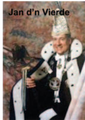
Jan d'n Vierde