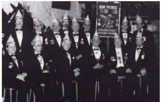
Raad van Oud Prinsen in het jubileumjaar 1983