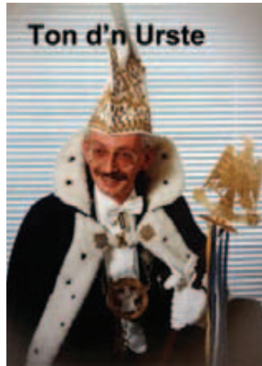
Ton d'n Urste