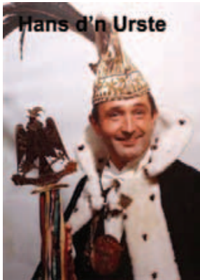
Hans d'n Urste