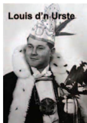
Louis d'n Urste